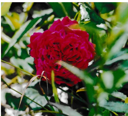
Rose de Resht (vor 1880) - betörend duftend

Erst mit den Teeschiffen kamen im 18. Jahrhundert Rosen aus Fernost, die ein phantastisches Merkmal besaßen: sie blühten den ganzen Sommer über bis zum Frost. Da war für die Rosenzüchter kein Halten mehr. Es gab unzählige neue Sorten, heute wird ihre Zahl auf über 30.000 geschätzt.